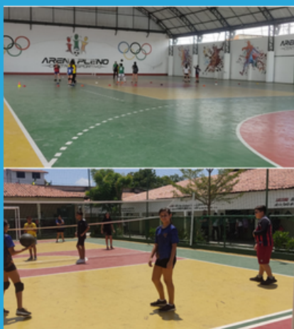
Club de volley et de foot