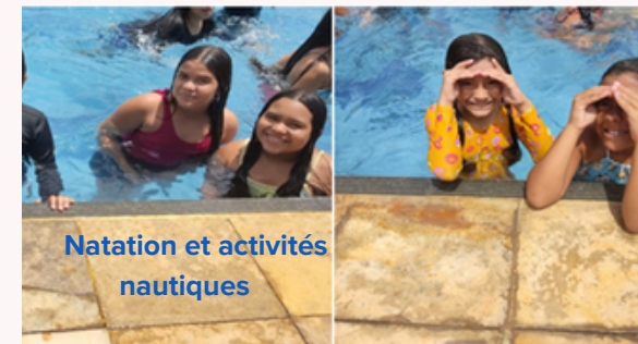
Natation et activités nautiques