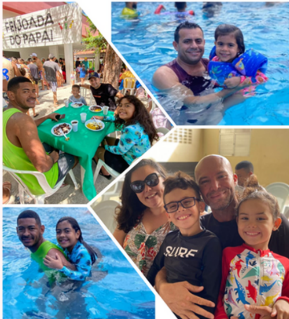
Fête des pères