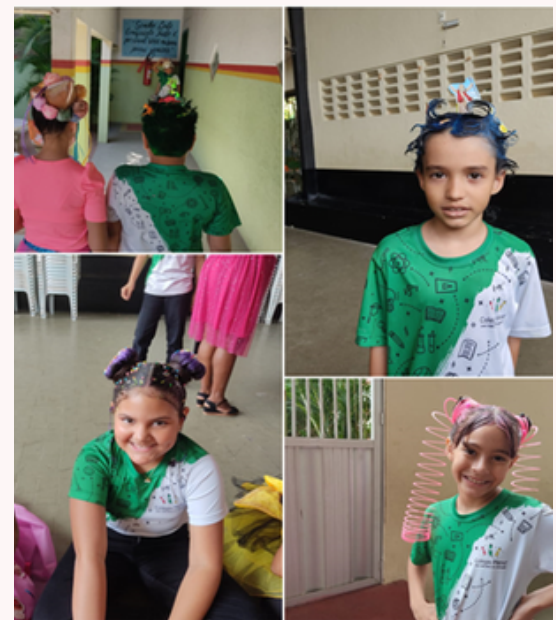
Concours de coiffures délirantes