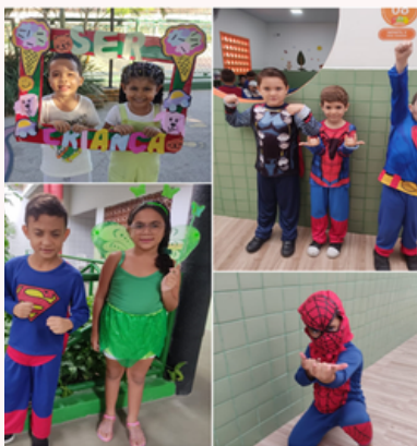
Journée Super Héros

Nous avons besoin de 20 parrainages à la rentrée 2025