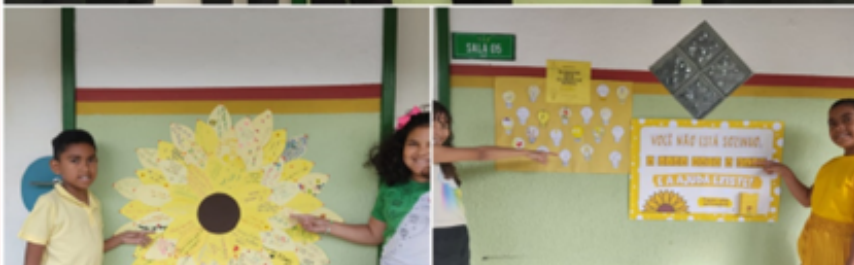
Septembre Jaune : Prévention du suicide